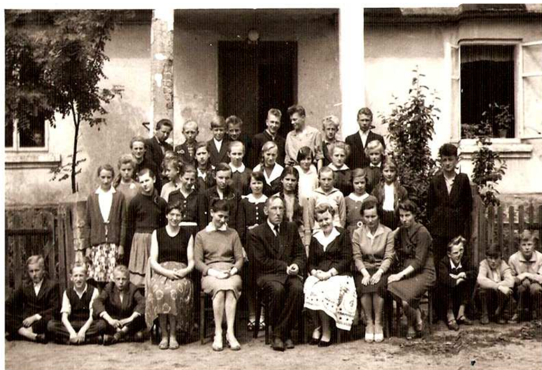
Absolwenci klasy VII wraz z nauczycielami - rok szkolny 1960/61.