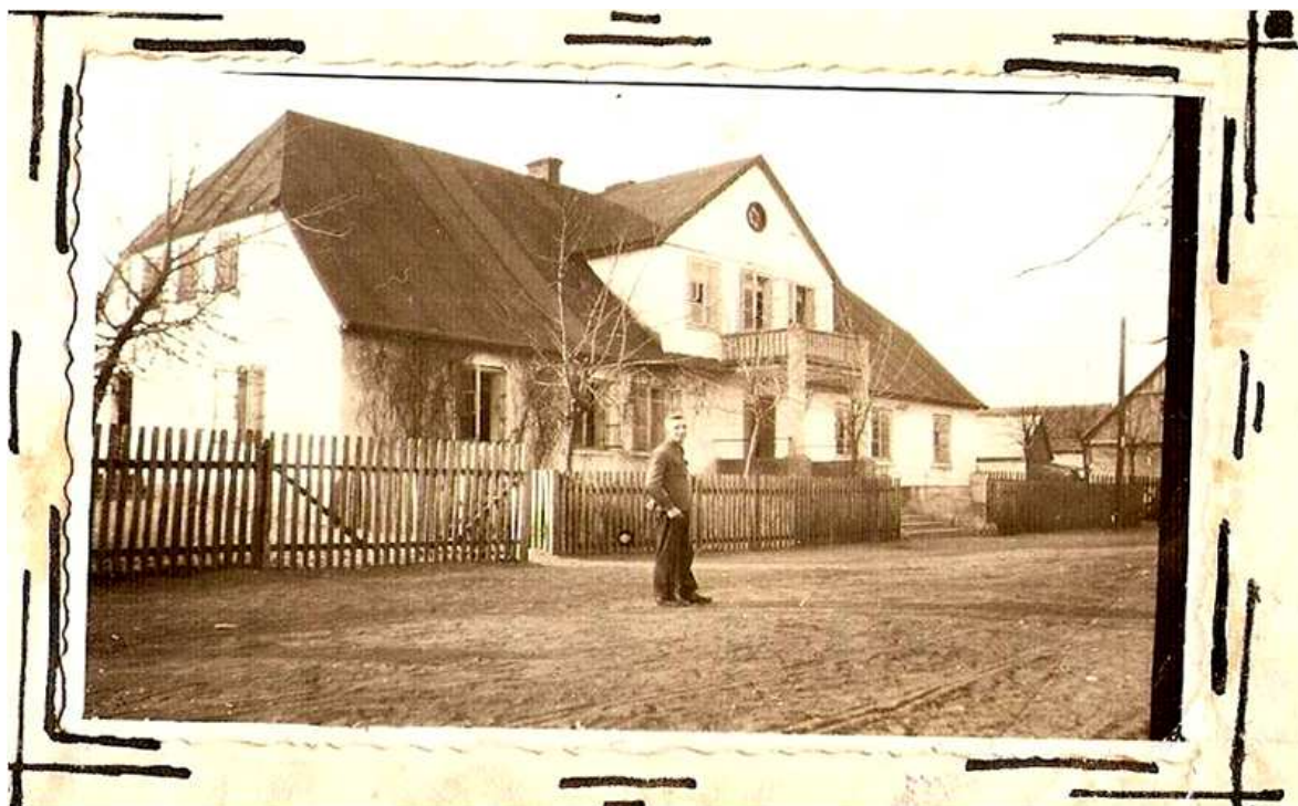
Budynek szkoły i urzędu gminy w Piekarach z 1919 r.