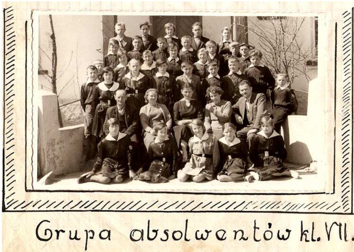
Absolwenci klasy VII - rok szkolny 1963/64.