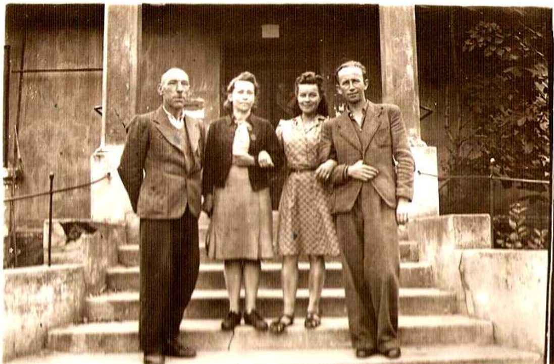
Grono nauczycielskie - 1946 r.