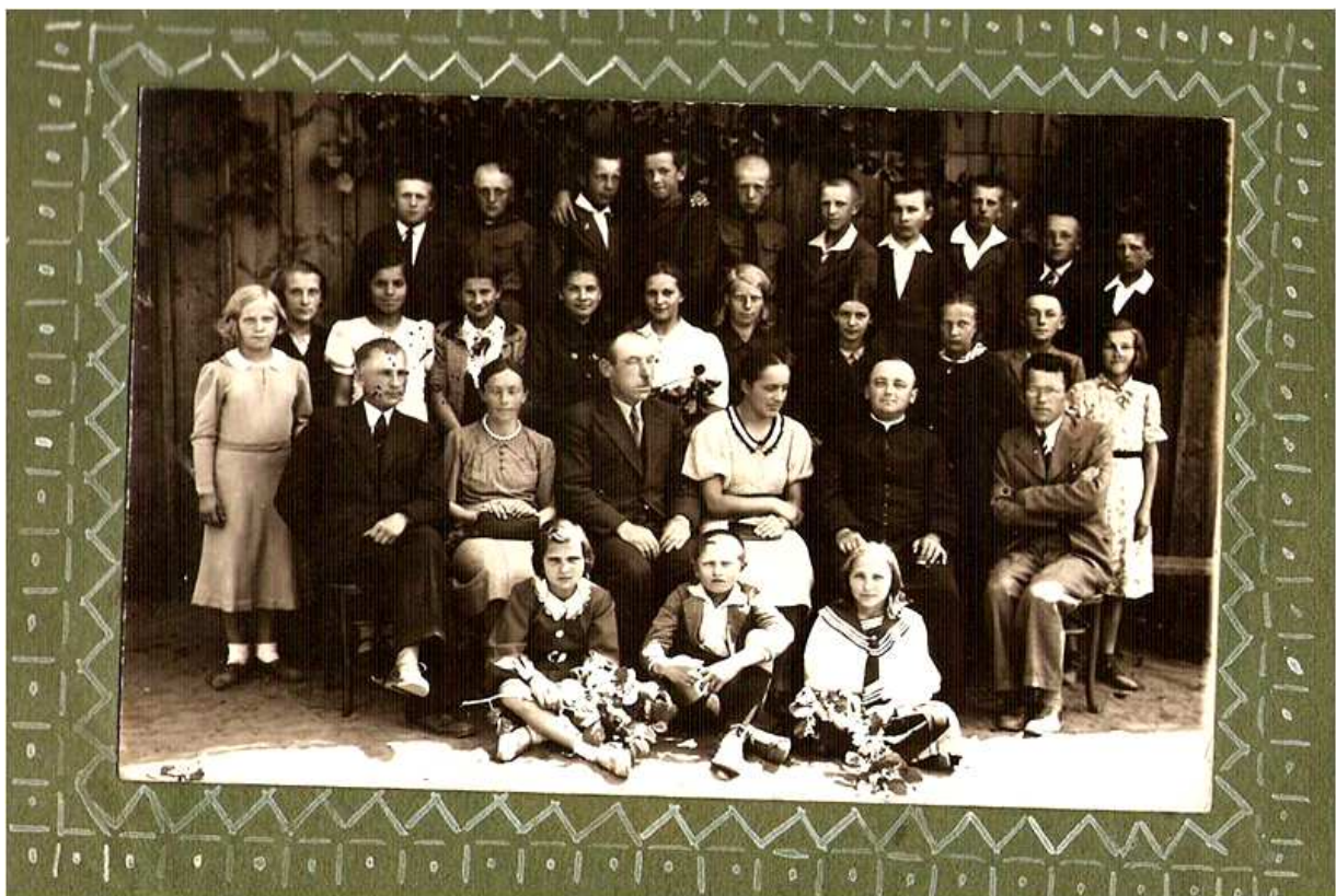
Grono pedagogiczne i absolwenci z czerwca 1938 r.