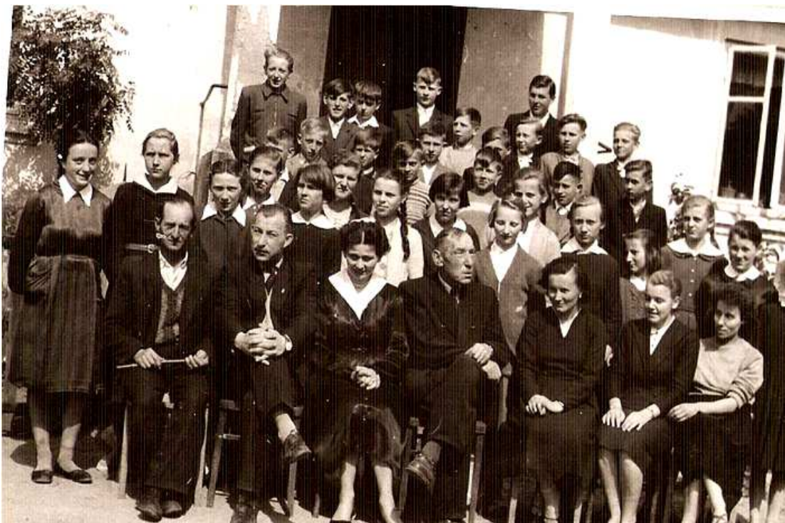
Absolwenci klasy VII wraz z nauczycielami - rok szkolny 1959/60.